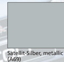
Satellit-Silber, metallic (A69)