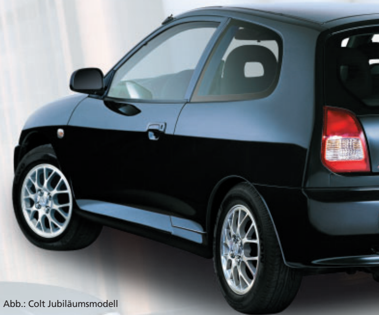
Abb.: Colt Jubiläumsmodell

** Unverbindliche Preisempfehlung der MITSUBISHI MOTORS Deutschland GmbH, 65468 Trebur, ab Importlager zzgl. Überführungskosten.