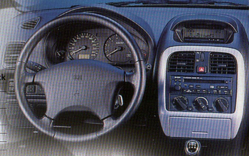
Abb.: Sonderausstattung Radio-CD-Kombination

Aerodynamik-Kit bestehend aus: Front- und Heckschürze, Seitenschweller, Heckspoiler, Radlaufabdeckungen hinten und Außenspiegeln ■ 4 Leichtmetallfelgen 17 Zoll mit Bereifung 215/40 R 17 ■ Sportauspuff ■ Fahrwerk-Tieferlegung ■ Aluminiumdekor in den Schaltermansolen der Scheibenheber und in der Mittelkonsole ■ Metallic-Lackierung ■ Fahrer- und Beifahrer-Airbag, Seiten-Airbags vorn ■ ABS ■ Seitenaufprallschutz ■ Elektronische Wegfahrsperre ■ Dritte Bremsleuchte ■ Nebelscheinwerfer ■ Klimaautomatik ■ Servolenkung ■ Zentralverriegelung mit Fernbedienung ■ Elektrisch einstellbare und beheizbare Außenspiegel in Wagenfarbe ■ Elektrische Scheibenheber mit Einklemmschutz ■ Fahrersitz, höhenverstellbar mit Lendenwirbelstütze ■ Lenkrad und Schaltknauf in Leder ■ Radiovorbereitung mit 6 Lautsprechern und Antenne ■ Mittelarmlehne vorn